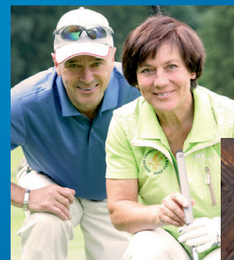
Rosi Mittermaier, Christian Neureuther und Felix Neureuther